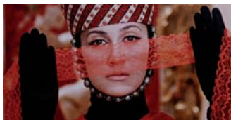
„Die Farbe des Granatapfels“, 1968 (6 russfilm)

Mit dem Leben von Armeniern in Vergangenheit und Gegenwart befassen sich auch fünf ausgewählte Filme. In „ Die Farbe des Granatapfels “ (UdSSR 1968) werden die Zuschauer in die Lebens- und Gedankenwelt des armenischen Dichters, Musikers, Komponisten und Geistlichen Sajat-Nowa (Arutin) aus dem 18. Jahrhundert versetzt. Der türkischstämmige Regisseur Fatih Akin zeigt in „ The Cut “ (D 2014) die Suche eines Überlebenden nach seinen Zwillingstöchtern. Dokumentarisch setzt sich „ Aghet - Ein Völkermord “ (D 2010) mit dem Genozid auseinander. Die von Schauspielern vorgetragene Zitate von Zeitzeugen wer-