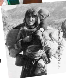
1915: Aghet – Die Vernichtung